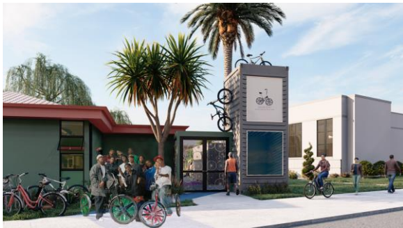
Representación conceptual de la Sucursal MLK Jr de la Biblioteca rediseñada.

La Biblioteca Públicas de Oakland ha estado refinando los diseños conceptuales de la ampliación de The Shed (El Cobertizo), el cual es un local comunitario de reparación de bicicletas instalado en 2016 que se encuentra ubicado en la Sucursal Martin Luther King Jr de la Biblioteca. El diseño (vista delantera abajo) aprovecha el espacio de la puerta que casi no se utiliza con el fin de crear un área multiusos dedicada a la reparación, enseñanza y otros programas relacionados con las bicicletas.