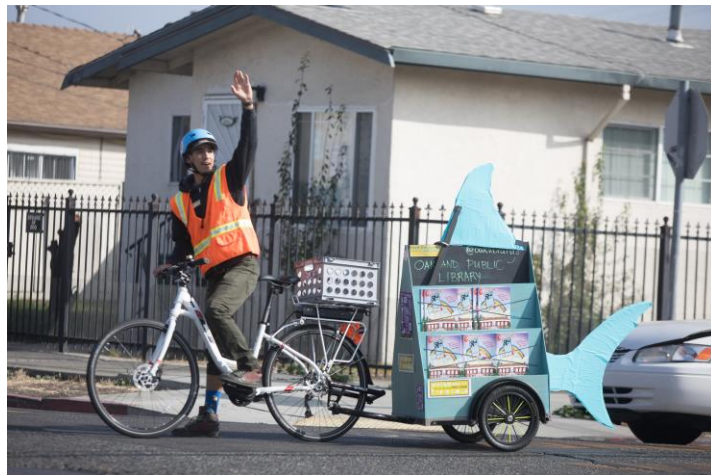
La Biblioteca en Bici de la OPL en pleno movimiento.

La Biblioteca en Bici de la Biblioteca Pública de Oakland promovió sus servicios en 18 eventos entre julio y diciembre de 2019, incluyendo su presencia cada mes en los eventos del primer viernes del mes del Museo de California de Oakland y en la sucursal Golden Gate de la Biblioteca para las reuniones del club femenino